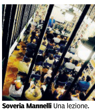
Soveria Mannelli Una lezione.

democrazia: il ruolo dei controlli parlamentari» che ha visto la partecipazione di Giuseppe Esposito, vicepresidente del Comitato Parlamentare per la Sicurezza della Repubblica, e Angelo Tofalo, del Comitato Parlamentare per la Sicurezza della Repubblica. E, in un mondo in rapido cambiamento, non è mancato l'approfondimento sul tema «Intelligence e globalizzazione: la nuova via della seta» con lezioni di Antonio Selvatici,