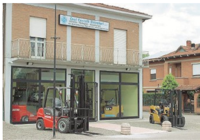
Orzi Carrelli L'azienda di Medesano ha 14 dipendenti.