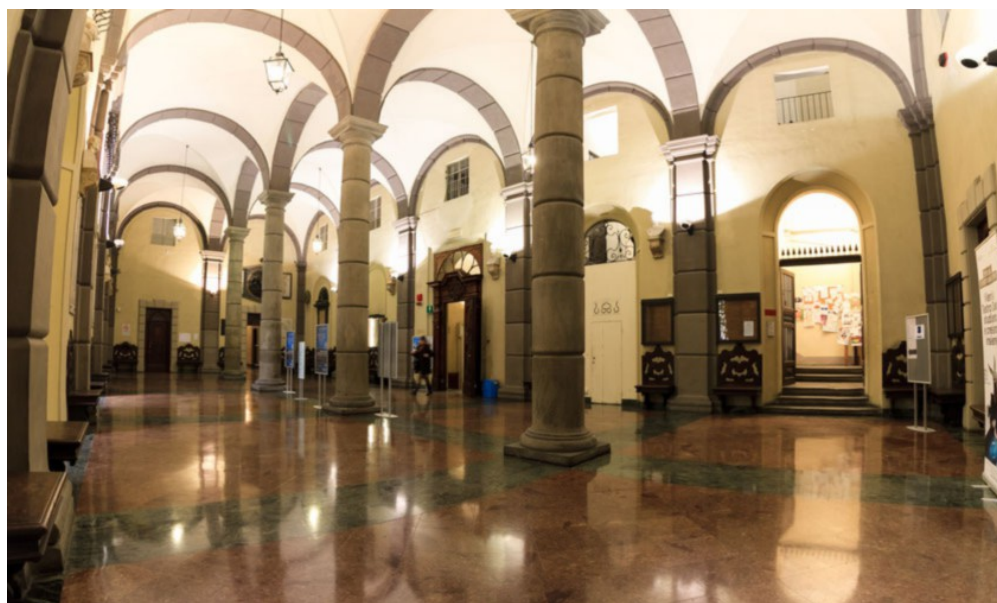
STUDIARE LA MAFIA PER COMBATTERLA L'Osservatorio Permanente Legalità è nato nel 2019.