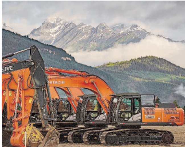
SICIM Un'immagine del cantiere in Canada.

Ledcor Pipeline Ltd., che fa parte di uno dei più grandi gruppi del Canada nel settore delle costruzioni. Questa operazione consolida Sicim sullo scenario dei grandi player dell'industria petrolifera mondiale, trasformandolo in un ambasciatore dell'alta capacità tecnica del Made in Italy. Il Trans Mountain Expansion Project ha un grande significato strategico per il Canada in quanto rappresenta un canale di sbocco per le proprie risorse sui mercati mondiali con ricadute economiche importanti per il Paese. Attualmente esiste una condotta di 1.150 chilometri tra la Contea di Strathcona, Alberta e Burnaby, nella British Columbia. Il progetto prevede l'ampliamento