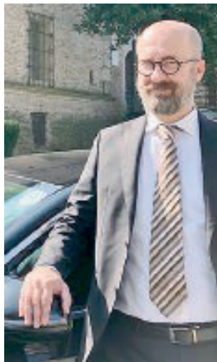
FIA Il vice presidente Rota.

«Noi non abbiamo utenti, ma clienti, che ci procacciamo attraverso contatti, investimenti in marketing, iniziative di rete e collaborazioni. I nostri passeggeri appartengono prevalentemente al mondo del business e del turismo. Ecco quindi che l'entrata in Confindustria vuole significare proprio la svolta che vogliamo