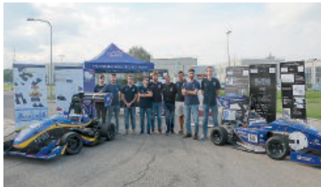
NOTTE DEI RICERCATORI Uno dei tanti stand del Campus.