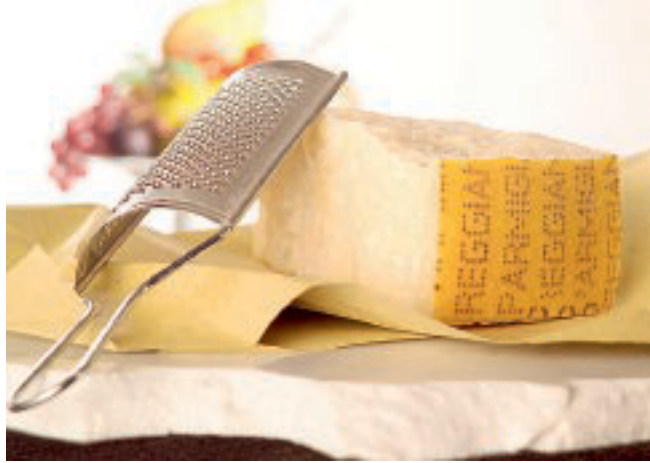
PARMIGIANO REGGIANO Nel 2018 oltre 850 ispezioni in 27 Paesi.

italiani». Il presidente del Consorzio ha poi aggiunto: «Saremo sempre in prima linea sia nelle fasi negoziali degli accordi internazionali, sia nell'esercizio delle funzioni di tutela per difendere un diritto di trasparenza che riteniamo sacrosanto per i consumatori di tutto il mondo». Non solo. «Per i caseifici del Parmigiano Reggiano - ha poi aggiunto - non è facile confrontarsi con multinazionali da oltre 20 miliardi di euro, il Consorzio del Parmigiano Reggiano ha depositato un ricorso contro la multinazionale Kraft Foods Group Brands LLC che sta tentando di ottenere la registrazione del «Kraft Parmesan Cheese» come marchio ufficiale in Nuova Zelanda.