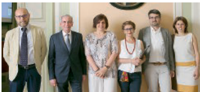
PALAZZO SORAGNA I protagonisti della presentazione del progetto promosso da Fiasa.

■ Quando si parla di malattie professionali, la parte più consistente di queste riguarda i disturbi osteo-articolari. Si tratta di patologie muscolo-scheletriche piuttosto diffuse tra i lavoratori che svolgono abitualmente attività di movimentazione manuale dei carichi o che mantengono a lungo la stessa posizione, con una postura scorretta. Nel nostro territorio si registra un aumento delle malattie professionali, con una particolare incidenza fra le donne (47% nel 2017) che operano nel settore dell'industria e dei servizi. È quanto emerso durante un in-