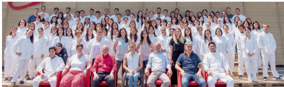
CORTE PARMA ALIMENTARE Foto di gruppo dell'azienda nata nel 2001.

Una nuova sede, ideata e disegnata per il benessere delle persone che ci lavorano. Con il posizionamento dell'ultima linea di produzione, si possono ritenere conclusi i lavori del nuovo stabilimento di Corte Parma Alimentare, l'azienda di affettamento e confezionamento di prodotti alimentari, attivo dal 2017 al Botteghino. Sebbene si tratti di una realtà relativamente giovane, infatti è nata a Traver-