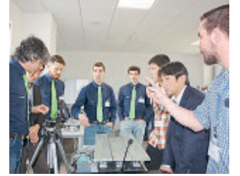
LAUMAS Lezione in corso.

■ Australia, Emirati Arabi, Germania, Giappone, Grecia, India, Israele, Malesia, Norvegia, Olanda, Portogallo, Romania, Russia, Sud Africa, Svezia e Zambia: questi i paesi di provenienza dei 30 dealers ospitati da Laumas Elettronica nei giorni scorsi per il «Primo Training Tecnico Internazionale» organizzato all'interno della nuova sede dell'azienda, da poco inaugurata. L'evento ha permesso all'azienda di formare a 360 gradi i propri partner internazionali su tutta la gamma di componenti per la pesatura Laumas e sui settori applicativi in cui questi possono essere impiegati.