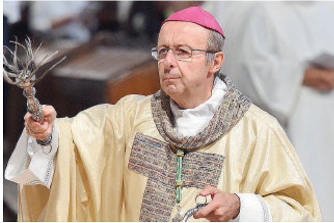
VESCOVO Le famiglie ferite al centro della nota pastorale.