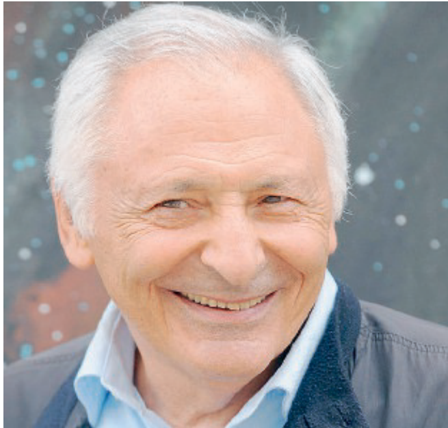
MOGOL. Lo spettacolo è a favore dell'Hospice Piccole Figlie.

grandi successi di Mogol reinterpretati dalla Filarmonica Toscanini al completo, diretta da Valter Sivilotti, ed eseguiti dal cantante e pianista An-