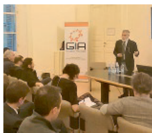
GIA L'incontro sugli Usa.

■ Gli Stati Uniti restano un mercato di assoluto riferimento, per le imprese italiane: basti pensare che nel 2017, le esportazioni verso quel Paese hanno raggiunto il valore record di 40,5 miliardi di euro, consentendo all'Italia di diventare l'ottavo partner commerciale degli Usa. Numeri che rappresentano un